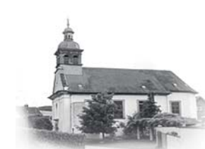
ST. ÄGIDIUS - Holz Kirchhausen