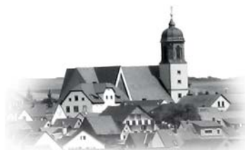
ST. MARTIN - Helmstadt