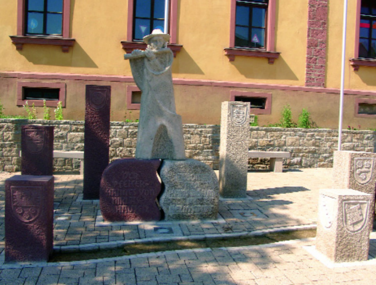
Das Denkmal für den Pfeifer von Niklashausen vereint mithilfe der unterschiedlichen Steinsäulen und der entsprechenden Wappen die Figur des Hans Böhm mit der Geologie, der Politik und mit den Konfessionen Helmstadts.

Zwischen Buntsandstein und Muschelkalk, zwischen den Grafen von Wertheim und dem Hochstift Würzburg und 1866 zwischen preußischen und bayerischen Armeen – die Grenzlage, in der sich Helmstadt immer wieder fand, brachte eine abwechslungsreiche Kulturlandschaft hervor, die der Kulturweg auf 10 km Länge präsentiert.