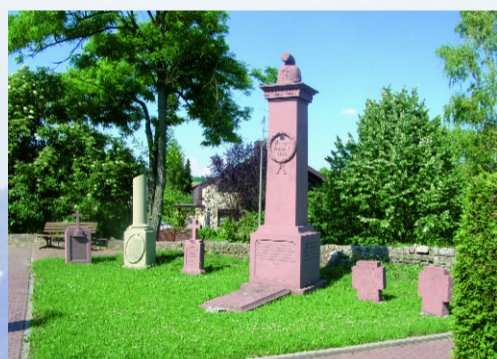
Im Jahr 1881 wurden die Gefallenen der Kämpfe von 1866 vom Kriegerverein Helmstadt in den Kirchhof umgebettet.