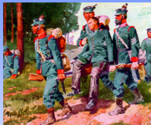
Während des Kampfes hatte eine preußische Gewehrkugel den Prinzen im linken Oberschenkel getroffen. Die Kugel konnte operativ nicht entfernt werden und erinnerte den Monarchen sein Leben lang an das Gefecht bei Helmstadt.

Das Ostlandkreuz auf dem Krammberg wurde 1951 von Heimatvertriebenen aus dem Sudetenland als Mahnmahl für die verlorene Heimat errichtet. Ein Gefecht im Deutsch-Österreichischen Krieg von 1866 auf den nahe gelegenen Feldern forderte über 2800 Tote und Verwundete. Auch der bayerische Thronfolger Ludwig wurde durch einen Schuss in den Oberschenkel verwundet. Die Info-Tafel informiert über das Gefecht und widmet sich dem Leid, das durch Krieg entsteht.