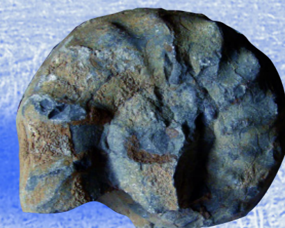
Fossil aus Helmstadt: Ammoniten (fossile Kopffüßer) beherrschten das Muschelkalkmeer.