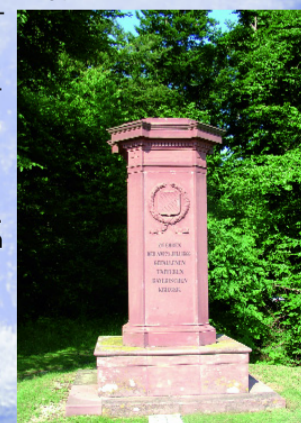
Das Bayern-Denkmal wurde vor 1871 errichtet.

Das Bayern-Denkmal erinnert an die Gefallenen der Verlierer des Gefechts von Helmstadt 1866. Die bayerische Infanterie trug die für sie typische blaue Uniform. Bewaffnet war der Soldat mit einem Vorderladergewehr, das nur im Stehen und umständlicher und langsamer als das preußische Zündnadelgewehr zu laden war. Die Last der Ausrüstung der Soldaten während des Feldzuges betrug 20 bis 25 kg. Die hohe Marschleistung von rund 500 km während des siebenwöchigen Feldzuges führte dazu, dass viele Soldaten wegen Erschöpfung oder Erkrankung ausfielen.