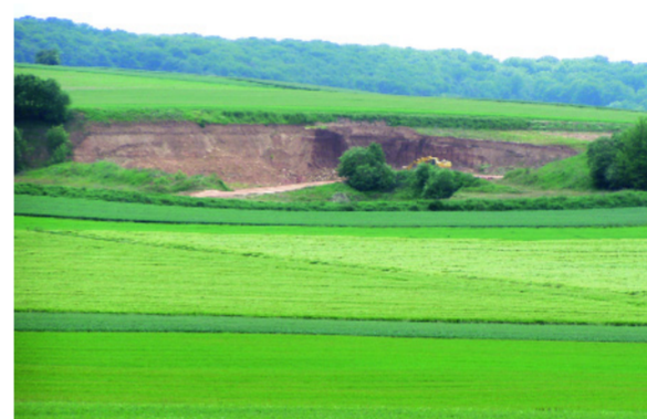
Die Lösslehmschicht setzt unmittelbar unter der Grasnarbe ein.

In Gedenken an die Schlacht von 1866 und an die Verwundung des bayerischen Prinzen Ludwig (des späteren Königs Ludwig III.) wurde 1909 in Helmstadt in feierlichem Rahmen das Prinz-Ludwig-Denkmal eingeweiht. Der Ort wurde blau-weiß geschmückt und der Prinz wurde mit einem Festzug, einem Festessen, einer Rede zu seinen Ehren sowie mit verschiedenen musikalischen Darbietungen gefeiert. Der Tag der Einweihung, der 3. Oktober 1909, ist einer der wichtigsten Tage in der Geschichte Helmstadts.