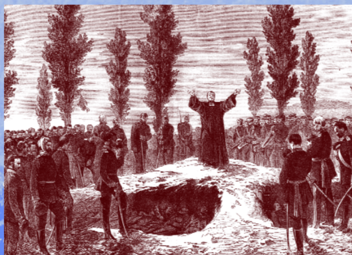
Begräbnis der Gefallenen von Helmstadt in einem Massengrab: Die Führung war mit der Versorgung der Verletzten überfordert.