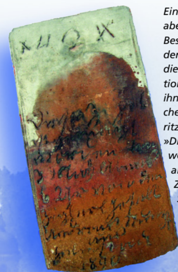
Ein so genannter »Feierabendziegel« aus dem Besitz der Ziegelei Wander. Diese Stücke waren die letzten der Produktion eines Tages. Auf ihnen wurden Sinnsprüche oder Bilder eingegritzt. Hier lautet der Text: »Diese Ziegel ist gemacht worden am 30. Aug. abends 6 Uhr von dem Zieglers Gesell Andreas Stumpf von Helmstadt 1890.«