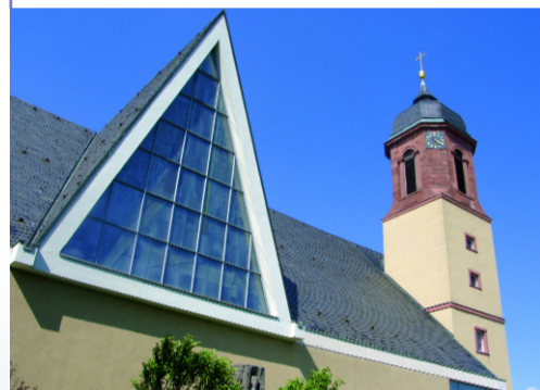
Neu und alt liegen bei der Helmstadter Martinskirche eng beieinander.