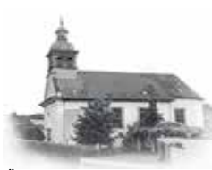
ST. ÄGIDIUS - Holz Kirchhausen