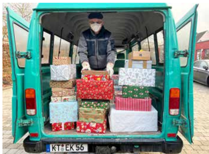
Foto: Mittelschule, Abholung der Weihnachtspäckchen durch die Rumänienhilfe „Karl“

Vielen Dank an all die fleißigen Helfer! Die Kinder in Rumänien werden sich sehr freuen.