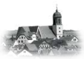
ST. MARTIN - Helmstadt