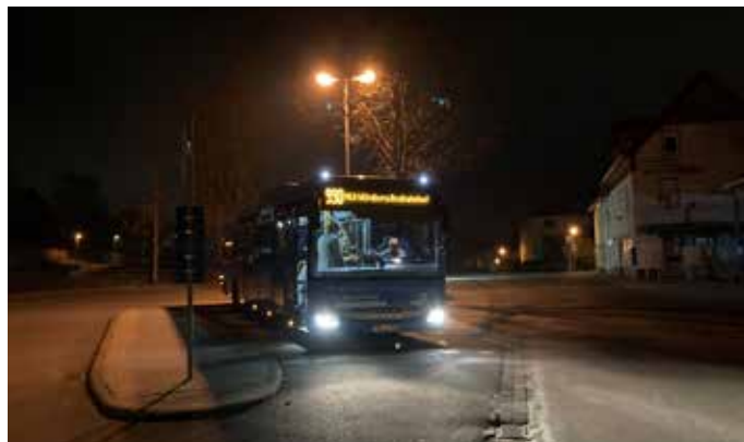
NightLife-Shuttle am ZOB in Tauberbischofsheim

Informationen zum Fahrplan und zu den Tarifangeboten des Verkehrsverbundes Rhein-Neckar GmbH (VRN) gibt es rund um die Uhr im Internet unter www.vrn.de , in der kostenlosen myVRN-App und unter www.vgmt.de . Ebenfalls rund um die Uhr erreichbar ist die telefonische Fahrplanauskunft und Ruftaxizentrale unter der Servicenummer Tel. 0621 - 10 77 077 . Das VGMT-Team steht während der Geschäftszeiten in der Geschäftsstelle in Landa oder telefonisch unter Tel. 09343 - 62 140 zur Verfügung.